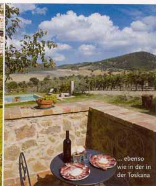
... ebenso wie in der in der Toskana